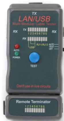
NCT-2 Tester UTP-USB