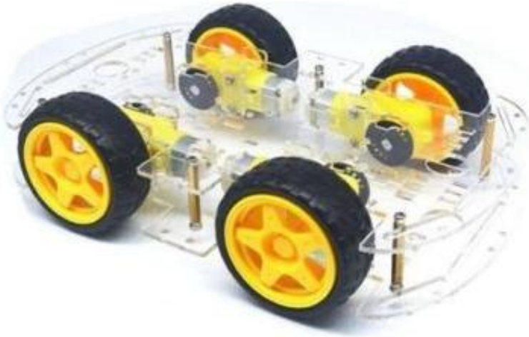
RT9001 KIT DE CHASIS DE COCHE 4 WD CON ENCODERS Y MOTORES