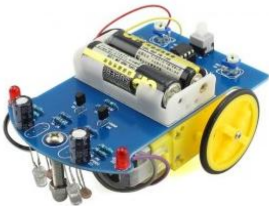
RT0155 KIT COHE SEGUINIENDO INTELIGENTE.