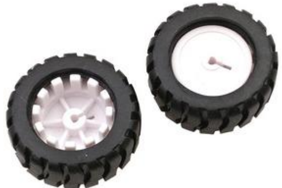
RT9006 RUEDA ROBOT 43 mm PARA MOTOR N20