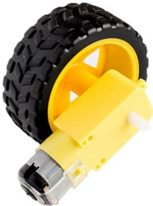
RT9002 KIT DE MOTOR REDUCTOR CON RUEDA 65 mm