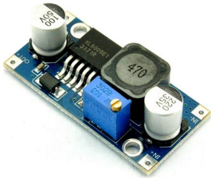
MD0711 MODULO DC-DC STEP UP 4.5-32V 4A XL6009