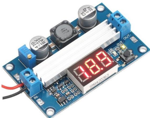
MD9060 MODULO DC-DC STEP UP 3-35 VDC 6A LTC1831