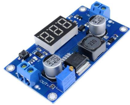
MD0712 MODULO DC-DC STEP UP 4.5-32V 4A XL6009 CON DISPLAY